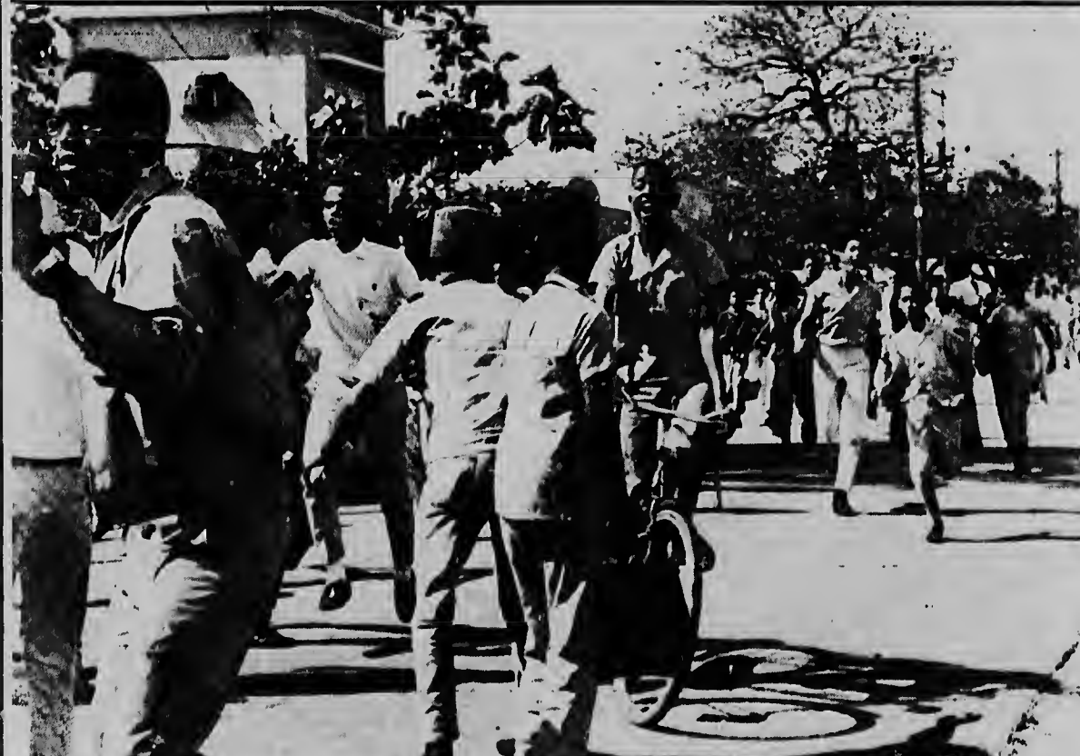
SANTO DOMINGO--Riba e portret aki nos por mira con e estudiantenan ta corre den cayanan durante un demonstracion anti-norteamericano dilanti di palacio nacional. Poliznan a mata cinco persona y a herida 43.